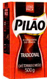
Fotos dos produtos da marca de referência

3.1. O detalhamento e especificações pormenorizadas do objeto desse termo de referência encontram-se no anexo: Apêndice I do TR.